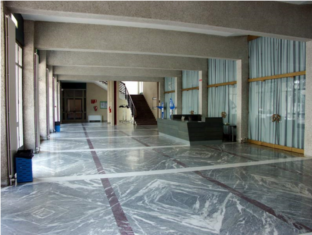
Politecnico di Torino