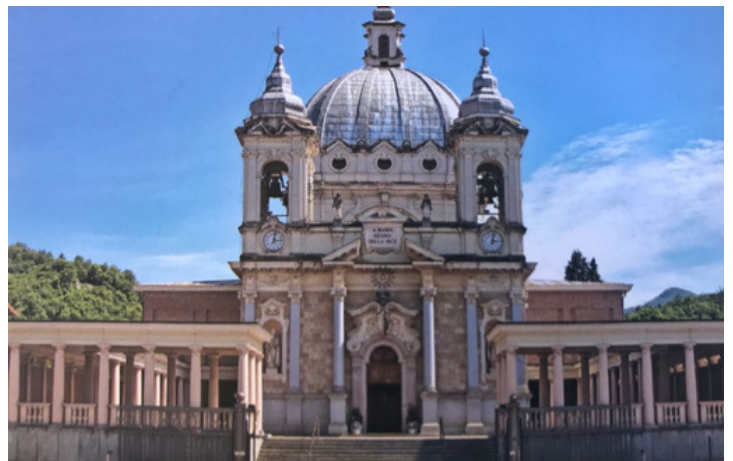
Santuario di Boves