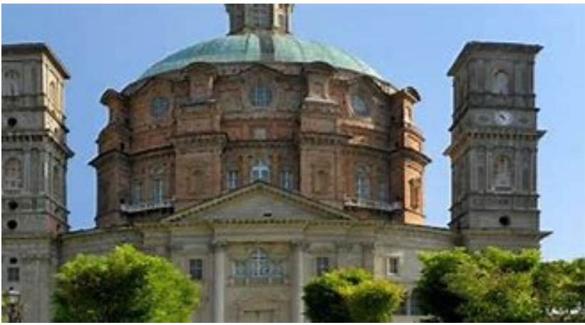
Santuario di Vicoforte