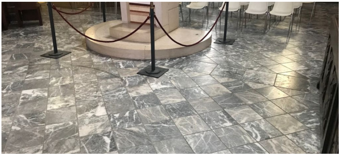
Duomo di alba